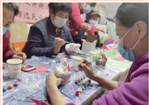
居民为兔儿爷涂上靓丽的色彩