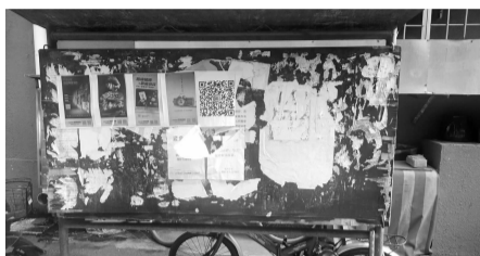
通知公告公告栏改造前