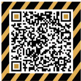
扫码了解“创享计划”详情

2021年6月10日,经过反复角逐,近百人参加的创享计划提案大赛落下帷幕。经过街道社区建设办公室、中国农业大学社会学系专家及北京工业大学社工系专家共同组建的评审团一致评审,最终征集到的78个金点子有效转化为52个提案及企事业单位“0元提案”2个。此次提案均围绕“社区环保、守望互助、社区融合、社区文化”四个方向,以“促进良性互动,共建美丽家园”为主题,广大居民自发提案,为建设社区建言献策。