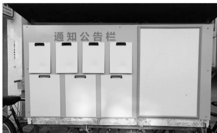
通知公告公告栏改造后