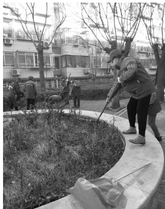
志愿者清理花坛中的垃圾

据不完全统计,本次大扫除18个社区共组织居民、志愿者近300余人参与,清理垃圾50余袋,卫生死角10余个,清理乱停放共享单车近20辆。除此之外,在大扫除中,部分社区还发现了居民