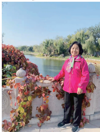
社区·双花园 作者·张京华