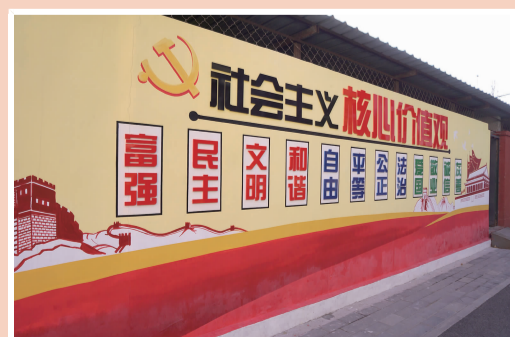
有机小区新增文化墙