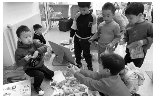
孩子向小摊主询问物品信息

“快来看了,买一送一啦……”11月29日至11月30日,富力社区启明德福幼儿园组织园内幼儿开展跳蚤市场。此次活动涉及园内大班及部分中班幼儿,共计180余位幼儿参与。