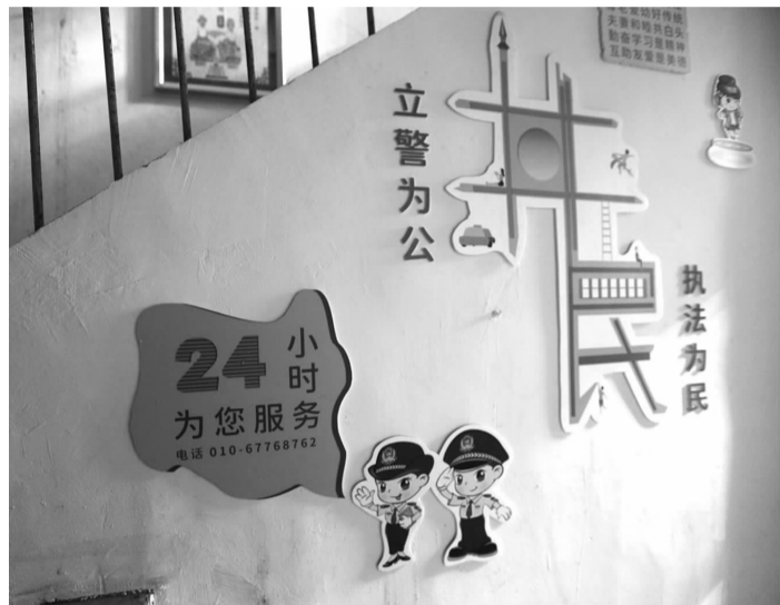
广和东里5号楼2单元改造后的楼门