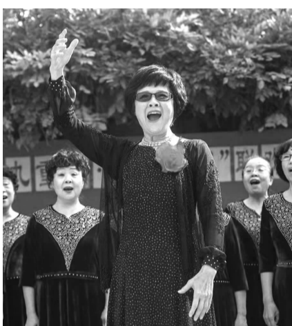
社区活动中领唱《我爱你,中国》