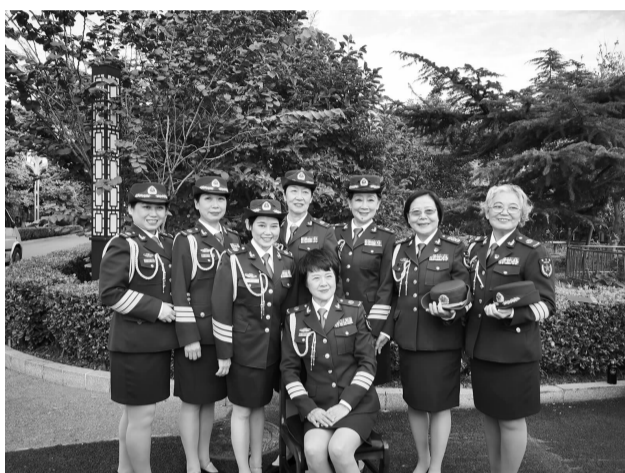
表演结束后,大家一起合影留念。