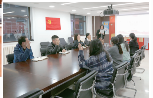
十九届六中全会精神知识问答活动