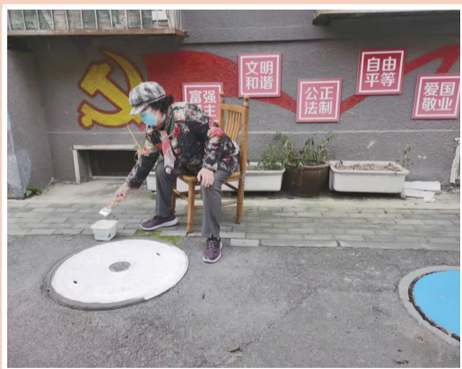
居民在井盖上绘制心仪的图案